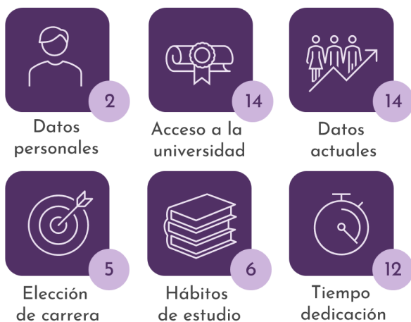
Fig.1. Dimensiones principales que agrupan las variables de perfil de usuario que identifican el riesgo de abandono (Llauró et al., 2023).

El modelo clasifica al alumnado en tres colores en función del riesgo de abandono: verde (sin riesgo o riesgo bajo), ámbar (riesgo moderado) y rojo (riesgo elevado), lo cual facilita a los tutores establecer prioridades en su acción tutorial en función del riesgo identificado. Para dicha clasificación, se definieron 6 dimensiones principales, donde se englobaron un total de 53 variables (según la Fig. 1), previamente identificadas y ponderadas en función de la importancia percibida por los tutores académicos.