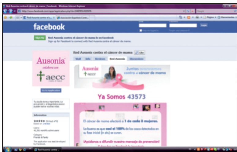
Figura 4. La alianza entre Ausonia y la AECC en Facebook