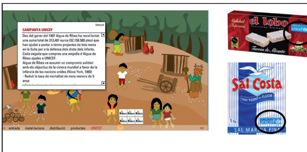
Figura 1. Ejemplos de envases de productos y marcas que incluyen el logotipo de una organización no lucrativa, y de página web corporativa que incluye información de los programas de marketing con causa realizados

12