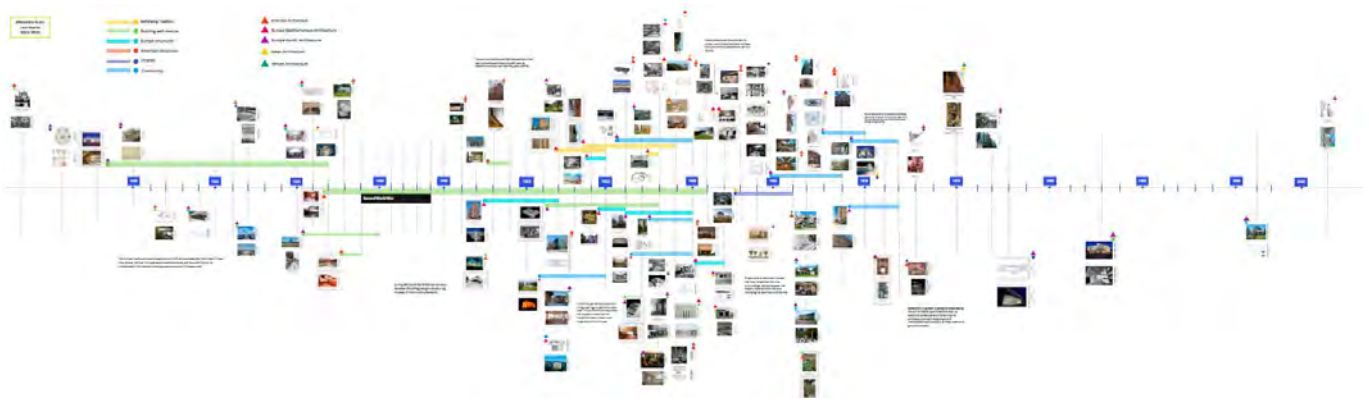
Fig. 2. Exemple de línia de temps desenvolupada en el taller col·laboratiu, resultat de la disposició dels cromos dels referents i la reflexió provocada.