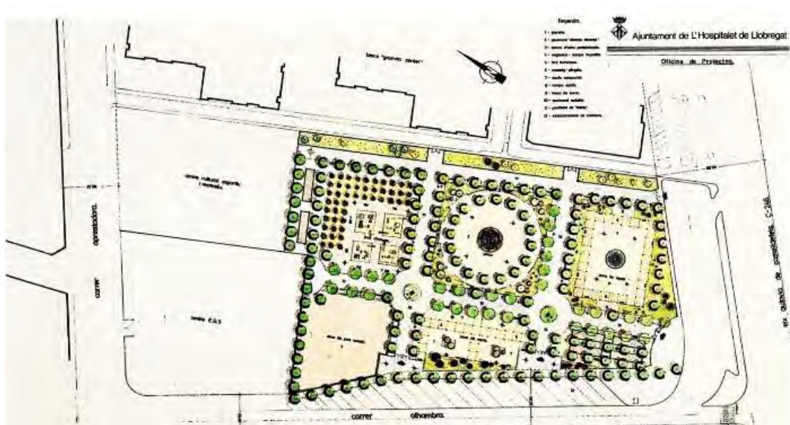
VI. Mapa del Parc de l'Alhambra

Les classes d'educació física estan repartides en dues sessions d'una hora a la setmana per grup. La idea és treballar la situació d'aprenentatge de forma seguida, realitzant les dues sessions setmanals sobre l'orientació, d'aquesta manera podrem treballar-ho d'una forma més continuada, repassant els conceptes per assimilar-los millor.