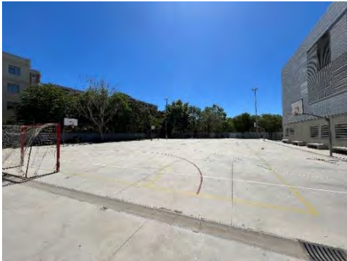
IV. Pati exterior del Bisbe Berenguer