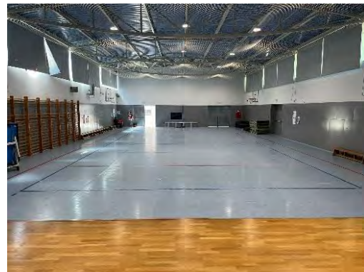
III. Pista interior del Bisbe Berenguer