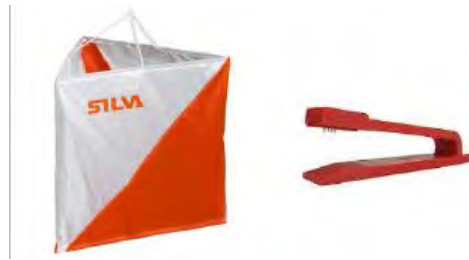
VII. Fites i pinces de control

patró de perforació diferent. Aquestes pinces serveixen per marcar en la targeta de control i confirmar que s'ha passat per la fita corresponent.