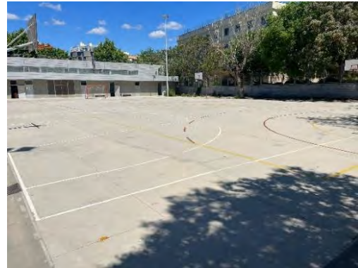
V. Pati exterior del Bisbe Berenguer