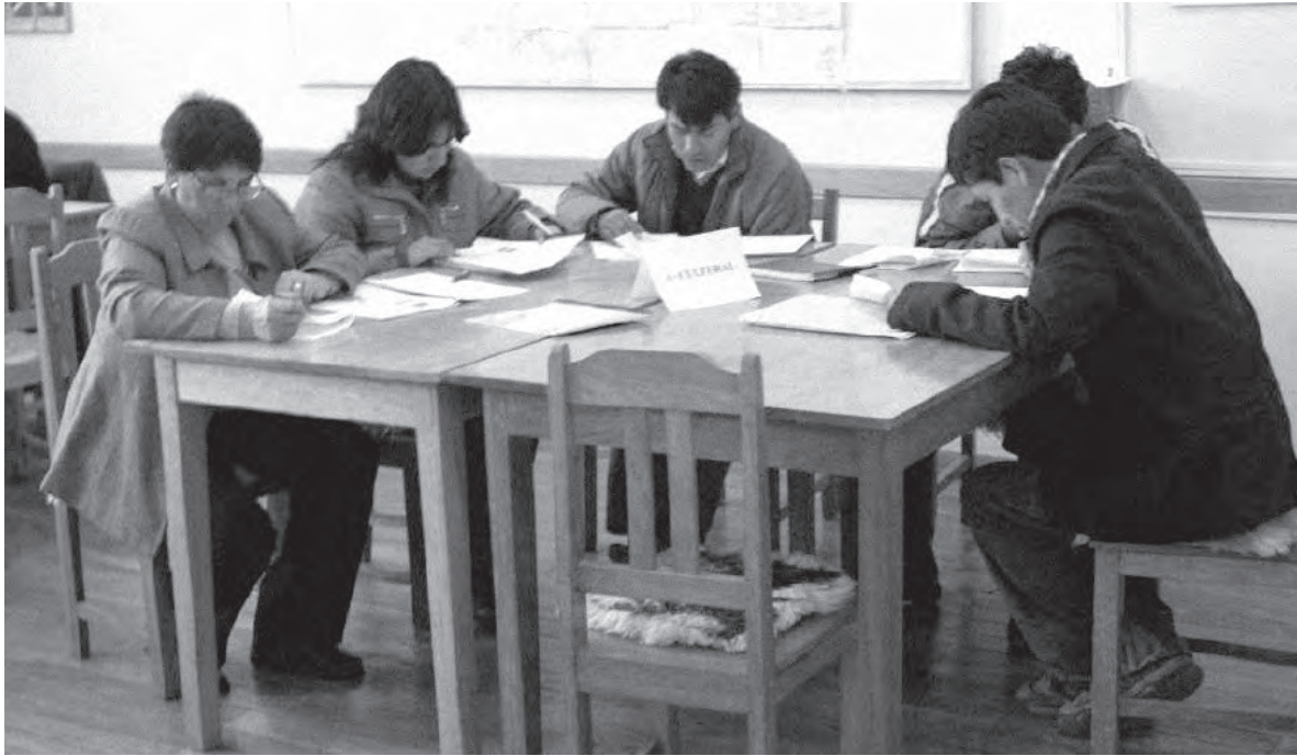
■ Taller de Evaluación de Recursos Turísticos

Desde 2009 se realizaron visitas a los distintos distritos de la Provincia con la finalidad de conocer los más de 60 recursos turísticos existentes en la Provincia, entre culturales y naturales. Una de las fortalezas ha sido el taller de Evaluación de los Recursos Turísticos, realizado en 2010. Mediante este taller, expertos de distintas disciplinas (biólogos, economistas, expertos en turismo sostenible, antropólogos, maestros, etc.) evaluaron, mediante criterios previamente establecidos, las fichas de los recursos turísticos levantada en 2009. Con ello, se consiguió obtener una visión más objetiva de la potencialidad real de los recursos turísticos existentes, para que posteriormente los productos turísticos creados sean coherentes con la demanda del mercado, así como sostenibles tanto a nivel cultural, económico y medioambientalmente.