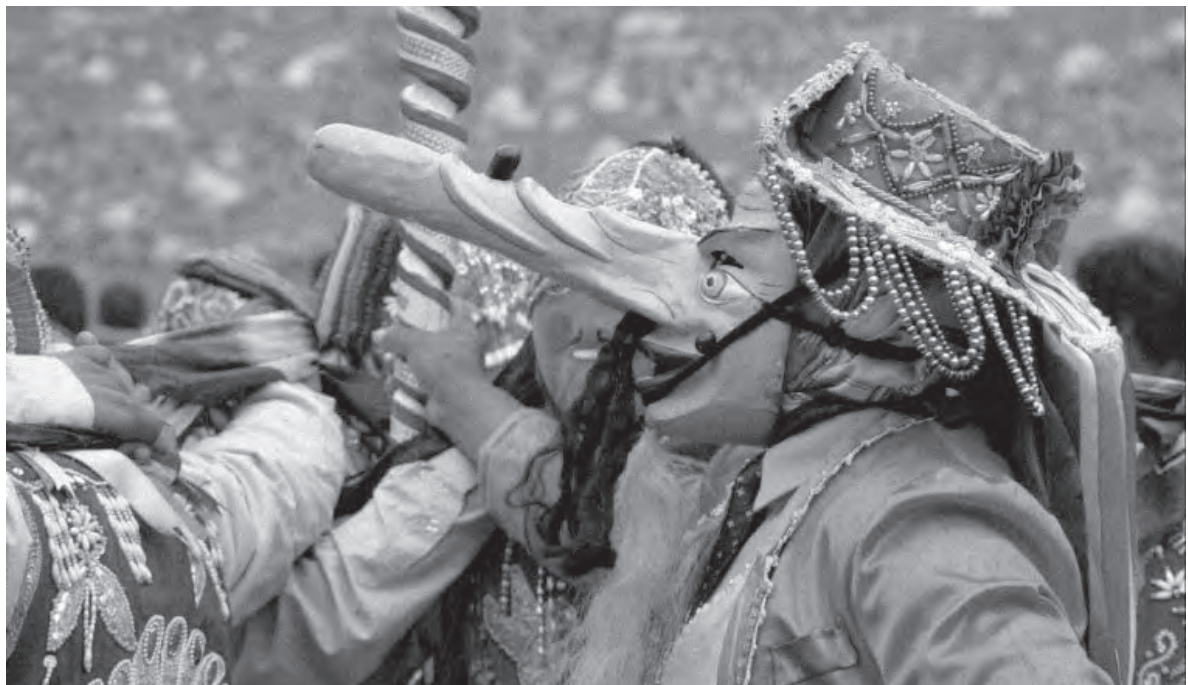
■ Festividad de Qoyllurit'i, Perú

Posteriormente, se desarrollan Los Productos y Actividades . Mediante el estudio previo de los productos turísticos actuales, la investigación de los productos potenciales y las demandas del mercado y empresarios se elaboran productos coherentes con las etapas de desarrollo del plan, facilitando a largo plazo el desarrollo económico y social de la región.