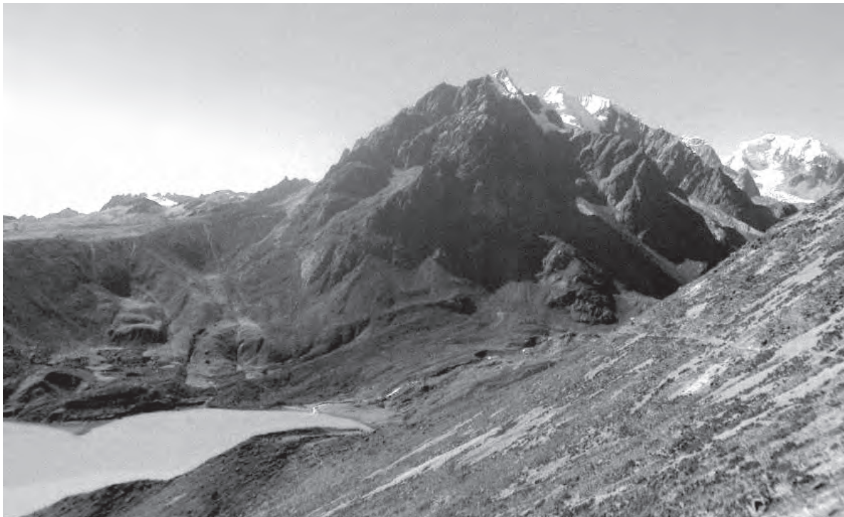
■ Cordillera de los Andes, Perú

A raíz del levantamiento de información, se obtuvo el documento que mostraba el estado actual de la Provincia de Quispicanchi, documento clave para posteriormente poder tomar las decisiones pertinentes.