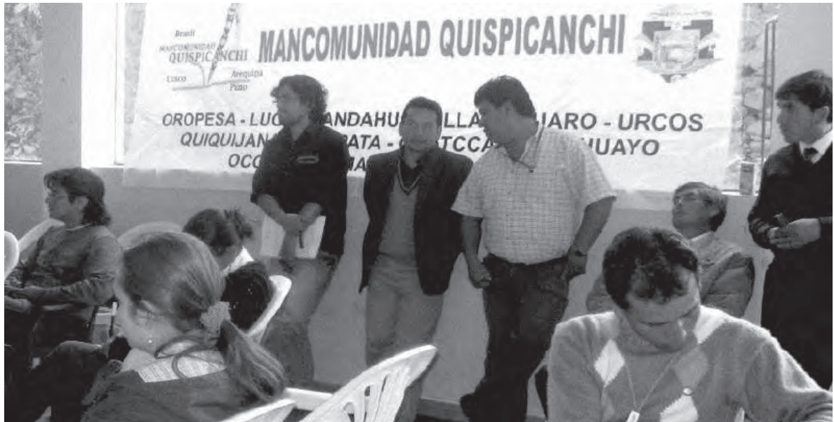
■ Comité consultivo de dirigentes locales

Posteriormente, se desarrollan Los Productos y Actividades . Mediante el estudio previo de los productos turísticos actuales, la investigación de los productos potenciales y las demandas del mercado y empresarios se elaboran productos coherentes con las etapas de desarrollo del plan, facilitando a largo plazo el desarrollo económico y social de la región.