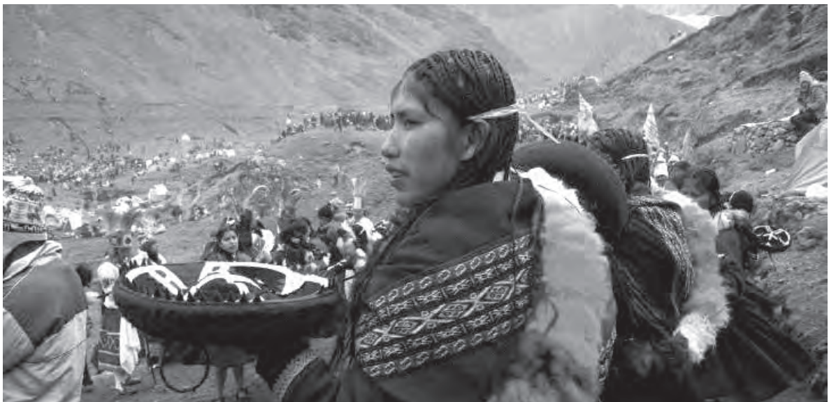
■ Población rural de los Andes, Perú

La primera fase, Análisis y diagnóstico , permite conocer las principales debilidades-amenazas y fortalezas-oportunidades del turismo en el ámbito de estudio para obtener un diagnóstico objetivo.