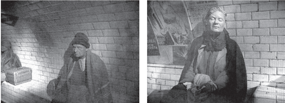
■ Projeccions d'imatges de refugis amb elements interpretatius. Imatges procedents de l'exposició "Quan el refugi és el subsòl" Al metro de Barcelona. Març 2008. Generalitat de Catalunya.

També es col·locarà un projector d'imatges que simulen els interiors dels refugis, degudament explicitats a través d'elements interpretatius.