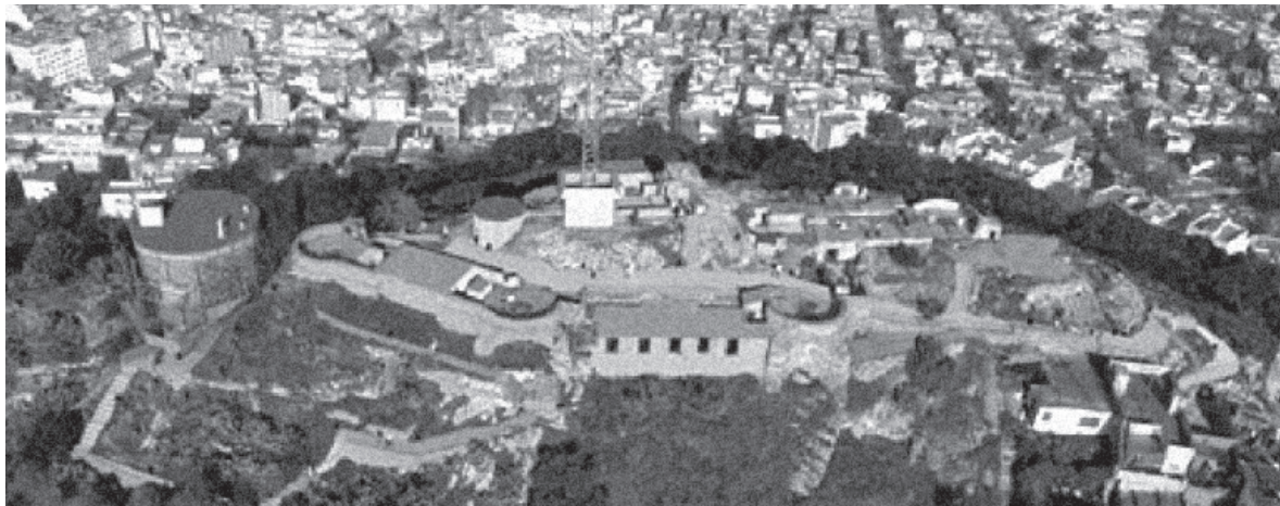
■ Vista aèria del cim del Turó de la Rovira amb les restes de construccions militars, entre d'altres.

El cim del Turó de la Rovira és l'espai triat per a situar-hi el centre d'interpretació " Barcelona Foradada ". Es tracta d'un lloc d'un gran atractiu paisatgístic, especialment per la possibilitat que ofereix de contemplar Barcelona en tota la seva extensió. És un mirador natural de la ciutat que possibilita la contemplació dels 360 graus de vista panoràmica.