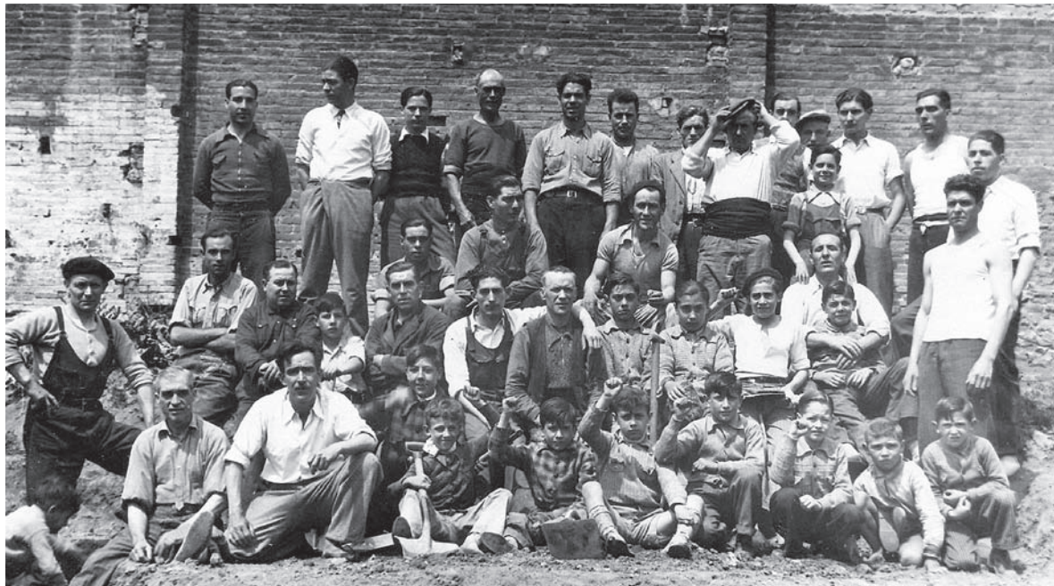
■ La construcció del refugi antiaeri de Poble nou.

Aquest record vol ser, principalment, informatiu i entenedor. No es tracta d'altra cosa, i no és poc, que de recordar als que van treballar per la seguretat dels seus conciutadans en moments de grans perills i dificultats de tota mena.