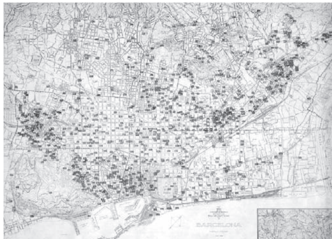
■ Plànol dels refugis de la ciutat de Barcelona, elaborat per la Junta de Defensa Passiva de Barcelona.

Elements interpretatius: Pantalla tàctil interactiva per a poder fer-se una idea de l'entramat subterrani amb el que compta la ciutat. A la pantalla es podrà veure un mapa de Barcelona, amb tots els refugis que es van construir. Es podrà ampliar la zona de Barcelona que es vulgui, per tal de visualitzar amb més claredat el nombre de refugis i la seva situació. Llistat de refugis de Barcelona.