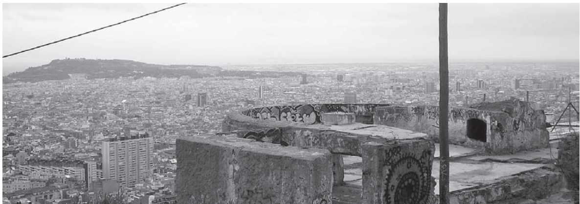
■ Turo de la Rovira. Vista general.

El lloc està abandonat, mancat de tota protecció, neteja o cura. El patrimoni es troba degradat pel pas del temps: il·luminació insuficient, pintades, mal us, deixalles de tota mena, inseguretat, terra desigual o inundat, dificultat en l'accés físic.