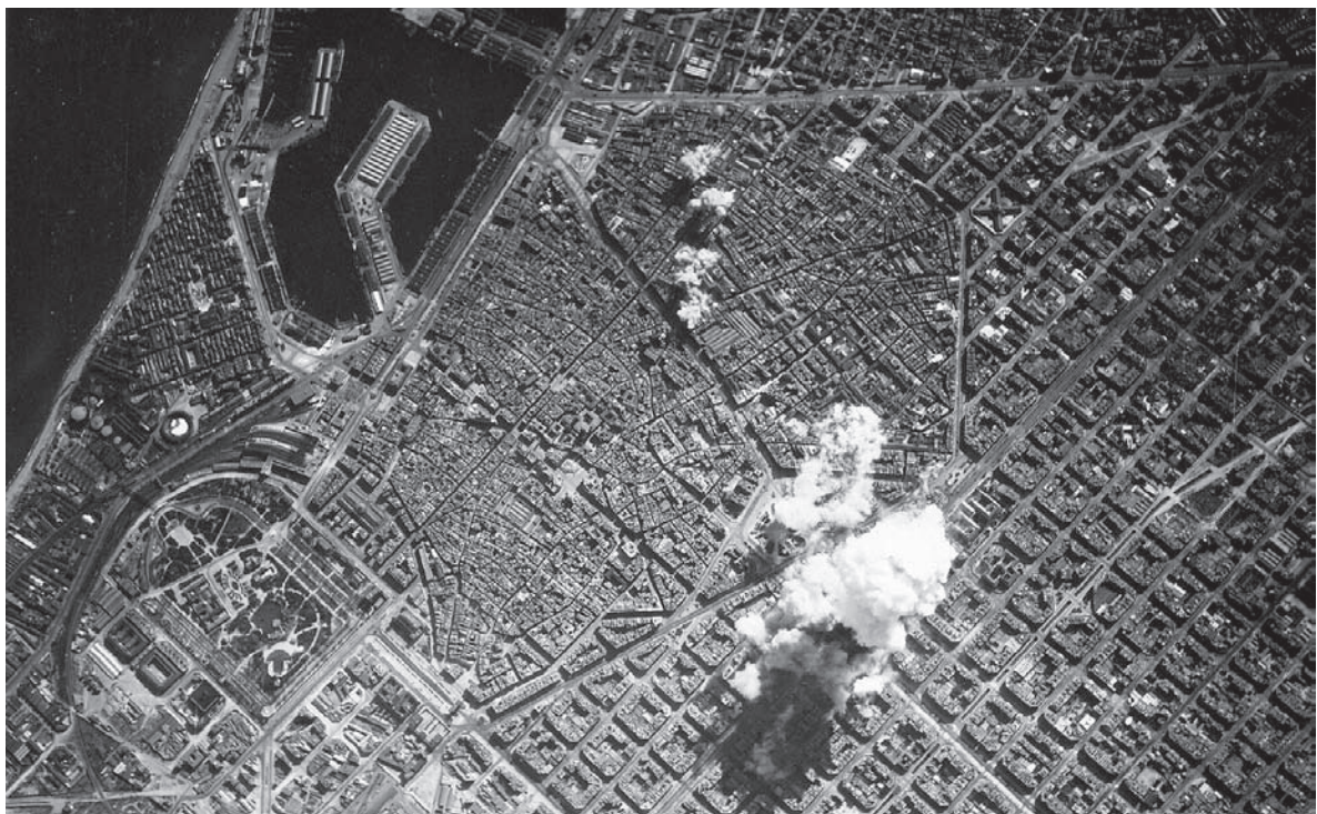
■ Vista aèria de Barcelona, 17 de març de 1938.

Durant la guerra civil espanyola, a partir de l'any 1937, la ciutat de Barcelona, entre d'altres llocs de Catalunya, va patir intensos bombardejos, tot i que no formava part del front de guerra. Aquests bombardejos van ser indiscriminats i per tant afectaren plenament a la societat civil del moment. El govern i la població van haver de fer-hi front i es va construir, amb la plena participació popular i en molts casos per la seva iniciativa, un important nombre de refugis antiaeris, espais soterranis per tal de salvaguardar la població. Se'n van comptabilitzar fins a 1.400.