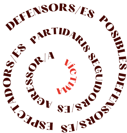
Figura 1: Esquema òptic dels agents implicats en una situació d'assetjament escolar

Font pròpia. Cercle del Bullying (adaptat de Dan Olweus, (2001)