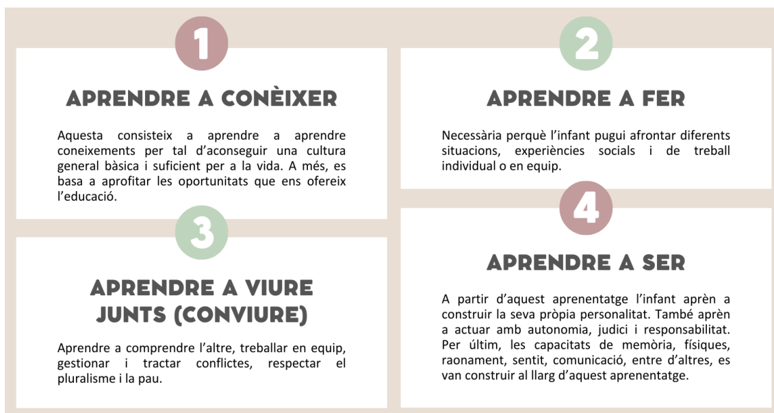
Epígraf 1: Els quatre pilars de la UNESCO.

L'educació és un instrument imprescindible perquè la societat del segle XXI pugui avançar cap a un futur de pau, llibertat i justícia social. La Comissió Internacional de la UNESCO (1996) va proposar en un informe titulat "La educación encierra un tesoro" els quatre pilars fonamentals que l'educació ha de complir. Aquests són aprendre a conèixer, aprendre a fer, aprendre a viure junts i aprendre a ser. Al llarg d'aquest treball es farà constància que encara no s'han complert un dels quatre pilars de l'educació, aprendre a viure junts (conviure).