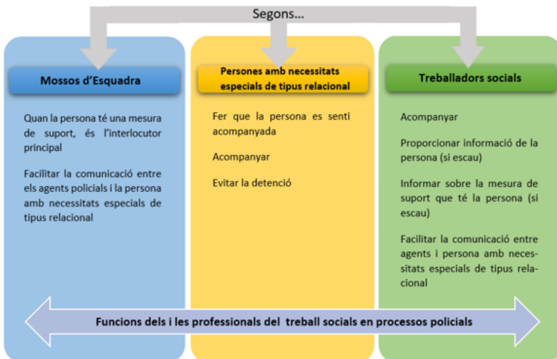
Gràfic 2: Funcions del i la treballadora social en procediments policials amb persones amb necessitats especials de tipus relacional

Una tercera figura que en alguns casos pot intervenir en situacions en les quals persones amb necessitats especials de tipus relacional tinguin algun tipus de relació amb les forces i cossos de seguretat és la del o la professional del Treball Social. Al gràfic 2 es plasmen les funcions que tenen els i les professionals del Treball Social en aquestes situacions des de la perspectiva dels mateixos professionals del Treball Social, les persones amb necessitats especials de tipus relacional i les i els mossos d'esquadra.