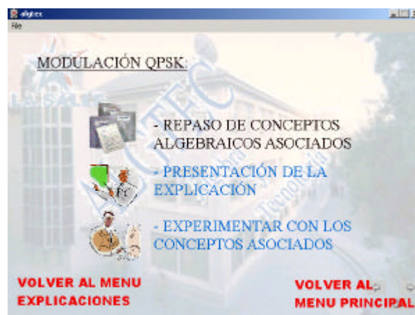
Figura 2: Menú asociado a cada una de las situaciones técnicas presentadas.

puede plantearse desde un punto de vista algebraico, y guía al alumno hasta hacerle comprender de qué modo la aplicación de conceptos algebraicos puede solucionar el problema planteado. El alumno controla en todo instante el flujo de la aplicación, por lo que puede pedir la repetición de una parte de la explicación, avanzar, retroceder o volver al menú principal, cumpliendo así otro de los principios fundamentales (principio de libertad) que debe darse en una aplicación multimedia [3]. Una vez que el alumno ya ha asimilado la explicación dada por el agent , puede poner en marcha la parte experimental de la aplicación para probar lo que ha entendido. Pongamos un ejemplo: