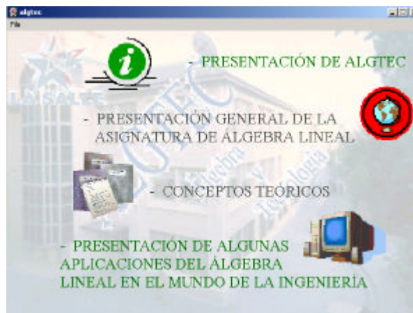
Figura 1. Pantalla inicial de la aplicación ALGTEC

Al poner en marcha la aplicación aparece la pantalla que se muestra en la figura 1 , con las 4 opciones iniciales disponibles: una 'autopresentación' de la aplicación, una visión global de la asignatura de álgebra impartida en nuestra universidad, la posibilidad de consultar conceptos teóricos, y la última de las opciones disponibles, que presenta un nuevo menú que permite al usuario seleccionar una de entre varias situaciones técnicas presentadas. Acto seguido, da la opción de visualizar una explicación detallada de cómo el álgebra puede ayudarnos en la situación elegida, o bien de experimentar con los conceptos algebraicos implicados, realizando simulaciones que permitan hacer pruebas y validar razonamientos.