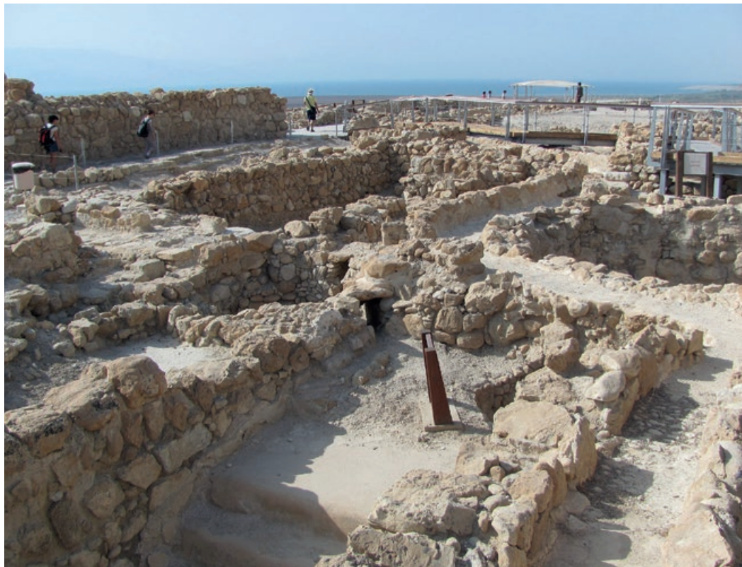
Ruïnes del monestir esseni de Qumran, situat a la vora de la Mar Morta.

escampats per Egipte. Un grup que van decidir passar la vida en estat de contemplació dins d'aquella comunitat. A Mareot s'hi portava una vida sense gens ni mica de vida activa , com, per contra, sí que s'esdevenia amb els jueus essenis de Qumran, a les riberes de la Mar Morta. Els essenis tenien com a model de vida la dedicació al treball i a la pregària . La contemplació dels de Mareot era contemplació de Déu, una contemplació que els suposava viure concentrats en la lectura silenciosa i complementària de la natura i de la Torà; una contemplació que els conduïa vers la visió de la realitat divina.