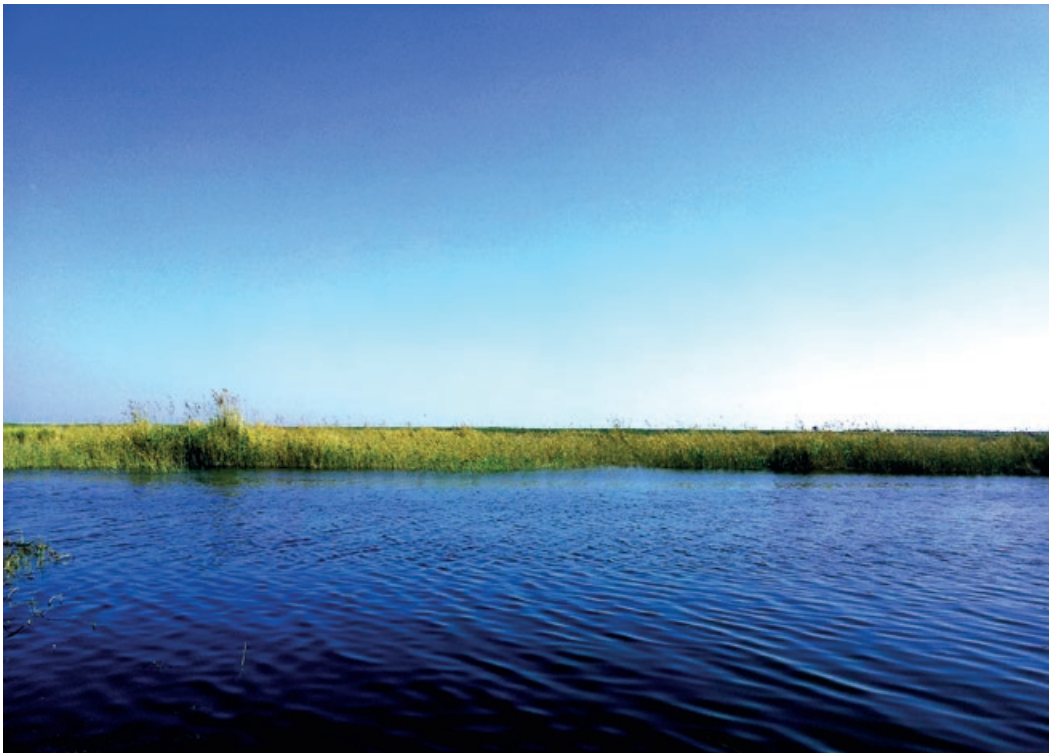
El llac de Mareot (avui Maryut) és un llac d'aigua salada situat a Egipte, separat del mar per un estret istme sobre el qual hi havia a l'Antiguitat la ciutat d'Alexandria. En aquest mateix istme s'hi ubicava la comunitat dels terapeutes i les terapèutides.

La «comunitat de Mareot» era un grup de contemplatius, «els millors», segons Filó, d'entre tots els contemplatius que hi havia