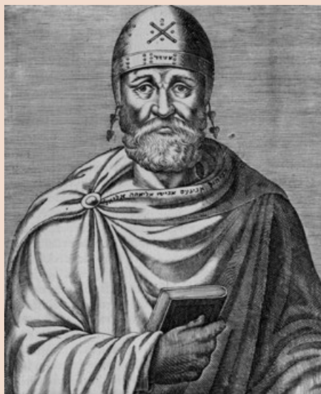
Filó d'Alexandria.