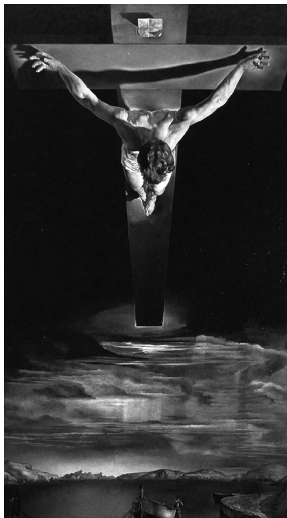
Crist de Port-Lligat de Salvador Dalí

Cal reivindicar un silenci sonor, com aquell del que parlava Sant Joan de la Creu, l'inspirador del Crist de Port-Lligat (1951; oli sobre tela; 205 × 116 cm.