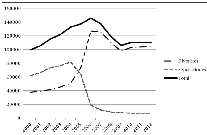
Figura 1. Evolución de las disoluciones matrimoniales 2000-2012.

Fuente: Instituto Nacional de Estadística. Autorizada su reproducción por cortesía del I.N.E.