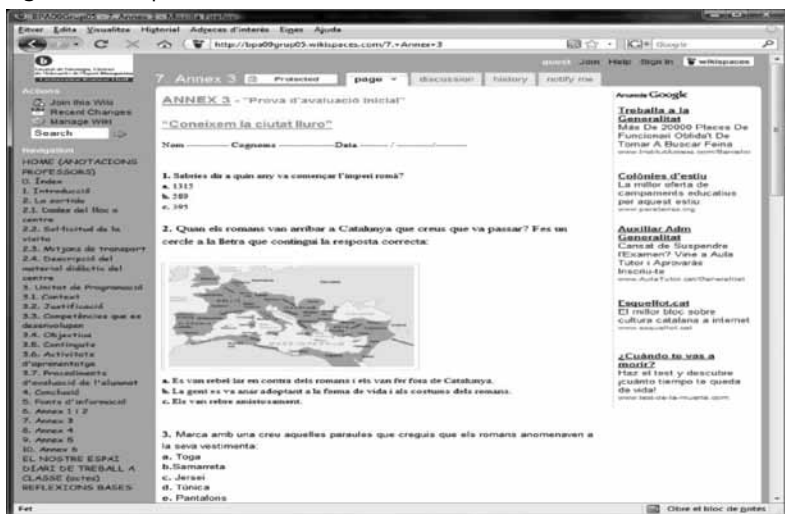
Figura 5. Exemple de Wiki d'estudiants

Els alumnes anaven fent el seu treball i el professorat, tant amb trobades presencials com, mitjançant el wiki, anaven supervisant no tan sols el procés que feia el grup, sinó també el contingut del treball. Setmanalment, els professors fèiem comentaris i suggeriments al voltant del treball que s'estava fent.