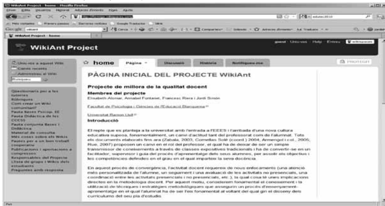
Figura 2. Pàgina principal Projecte WikiAnt

En una segona fase (octubre 2008 – febrer 2009), es van elaborar diversos materials que es poden consultar al http://www.wikiant.com , com ara: