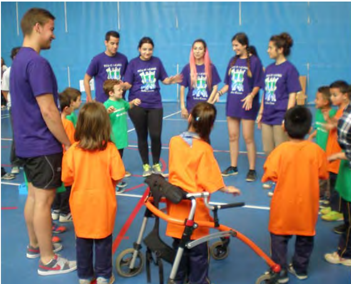
Figura 2. Fotografía del alumnado en el momento de implementación del Proyecto ApS en el Instituto Guttman.