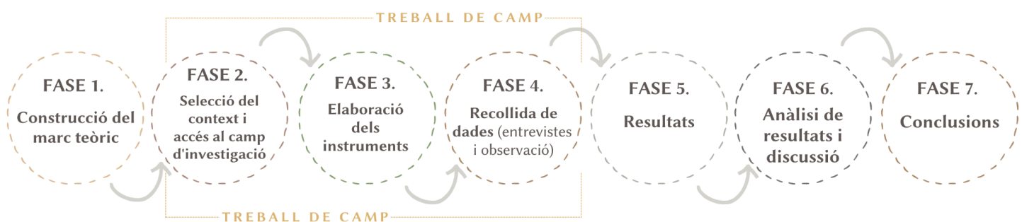
Figura 1. Cronologia del Treball Final de Grau, Pia Domènech (2021)

Per dur a terme la recerca hem passat per set fases, exposades a la figura 1 :