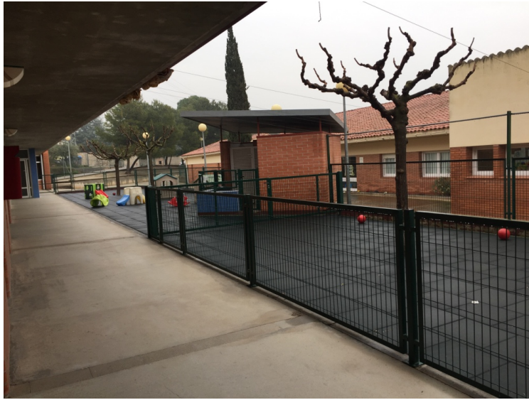
Figura 1. Fotografia de l'espai exterior de la llar d'infants