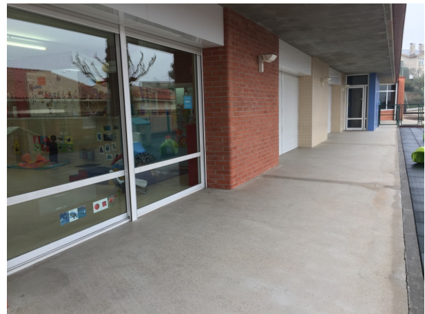
Figura 3. Fotografia de l'accés a l'espai exterior des de les aules de la llar d'infants

A la Figura 1, 2 i 3 es pot veure l'estat del pati en el moment que es van fer les observacions