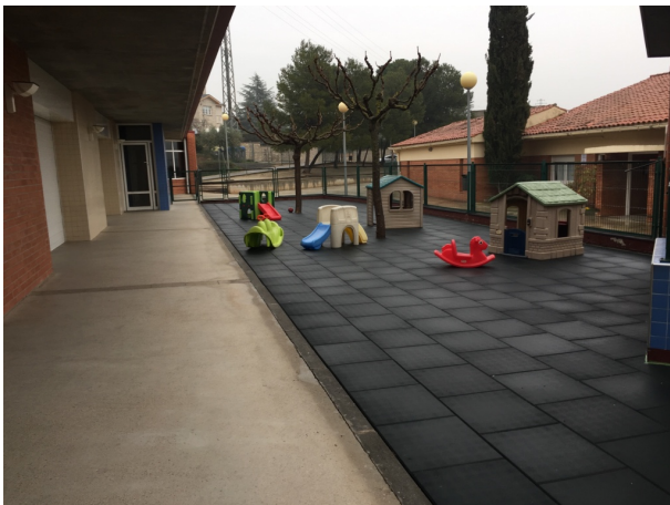
Figura 2. Fotografia de la part esquerra de l'espai exterior de la llar d'infants