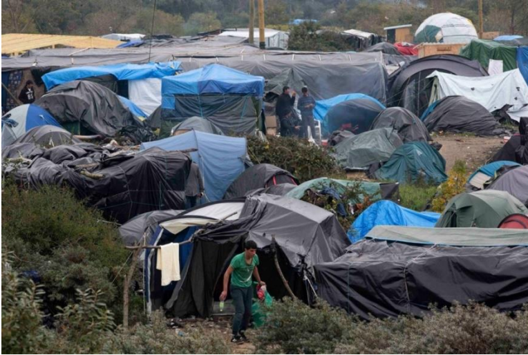
Fotografia extreta d'Al Jazeera America (2015)

Com podem observar a les imatges anteriors, no tots els camps estan estructurats de manera ordenada ni tenen tendes oficials de camp organització. Em sembla important de destacar ja que, tot i que penso que tothom estarà d'acord en que la primera fotografia del camp d'ACNUR tampoc són bones condicions per viure, desgraciadament és encara pitjor en molts casos.