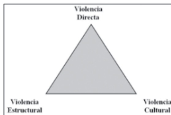
Figura 1.- Triangle de la violència de Galtung. Teoria del conflictes. Calderon, 2009.

Respecte a la relació que s'estableix entre els tres principals tipus de violència, Galtung (citat per Calderón, 2009) la representa per mitjà del triangle de la violència en el qual, la violència directa es troba al vèrtex superior per tractar-se de la major manifestació de violència i de l'atemptat contra els drets humans, i per ser la més visible. Pel que fa a la violència cultural i l'estructural, es troben a la base perquè són el sòl a partir del qual germinen les agressions com a resultats de les ideologies i la configuració de l'estructura social. En altres paraules, la violència directa correspon a la part d'un iceberg que sobresurt a la superfície, mentre que les altres dues tipologies de violència es troben en la part inferior que no és visible però que té un gran pes en el dany que s'ocasiona.