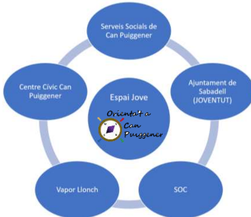
Il·lustració 2. Treball en xarxa

En ser un recurs que gestiona la Fundació Pere Tarrés, i en el marc de les reunions periòdiques amb el coordinador de l'Espai Jove, també se l'informarà i es treballarà per construir el projecte plegats.