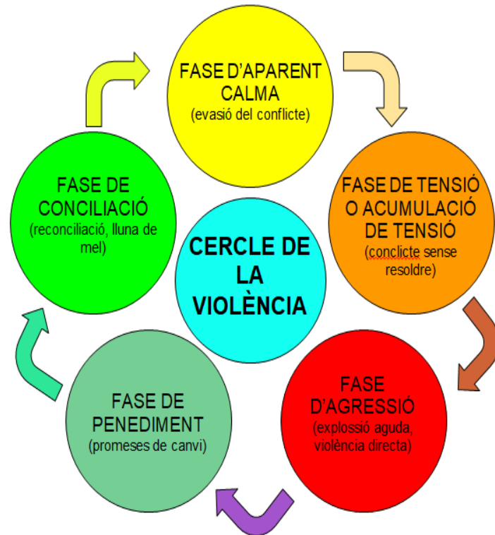
Figura 1: Cicle de la violència, elaboració pròpia segons Walker, L. (1989)

Si la dona protesta o no fa el que l'home espera, aquest reacciona cada vegada de forma més violenta (García, Y. i Jesús, A., 2014). Segons Paz (2009, 2011), existeixen diferents fases com es produeix i es manté el maltractament en una relació de parella, en cada període, també podem identificar els sentiments i problemes que pateixen les dones en cadascuna de les fases.