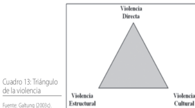
Gràfic 2. Triangle de la violència de gènere. Galtung (2003)

La violència de gènere, en relacions amoroses, es denomina violència estructural, concepte denominat per Galtung (2003), que explica que la violència de gènere té una triple dimensió: