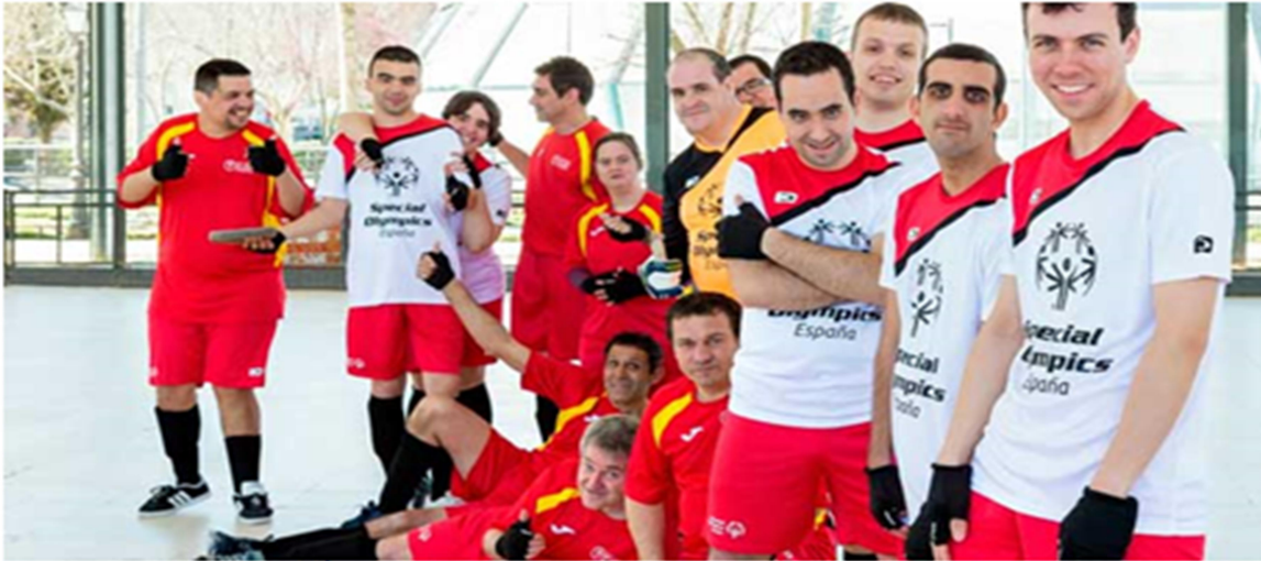
Imatge 6: Jugadors de Handball d'Espcial Olímpics