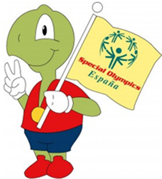
Imatge 5: Macota Special Olympics Espanya