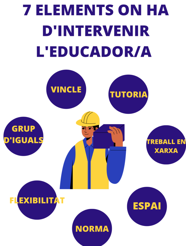
Figura 1. 7 Elements on ha d'intervenir l'educador/a.

Després de tota l'anàlisi i recull que he fet, marco set grans estratègies d'intervenció. Cal remarcar, que sense haver fet un model envers l'absentisme, destaco un seguit de conclusions i àmbits, que en línies de futur, són un acostament a l'elaboració d'un model específic d'intervenció per tal d'afrontar els casos absentistes a la UEC.